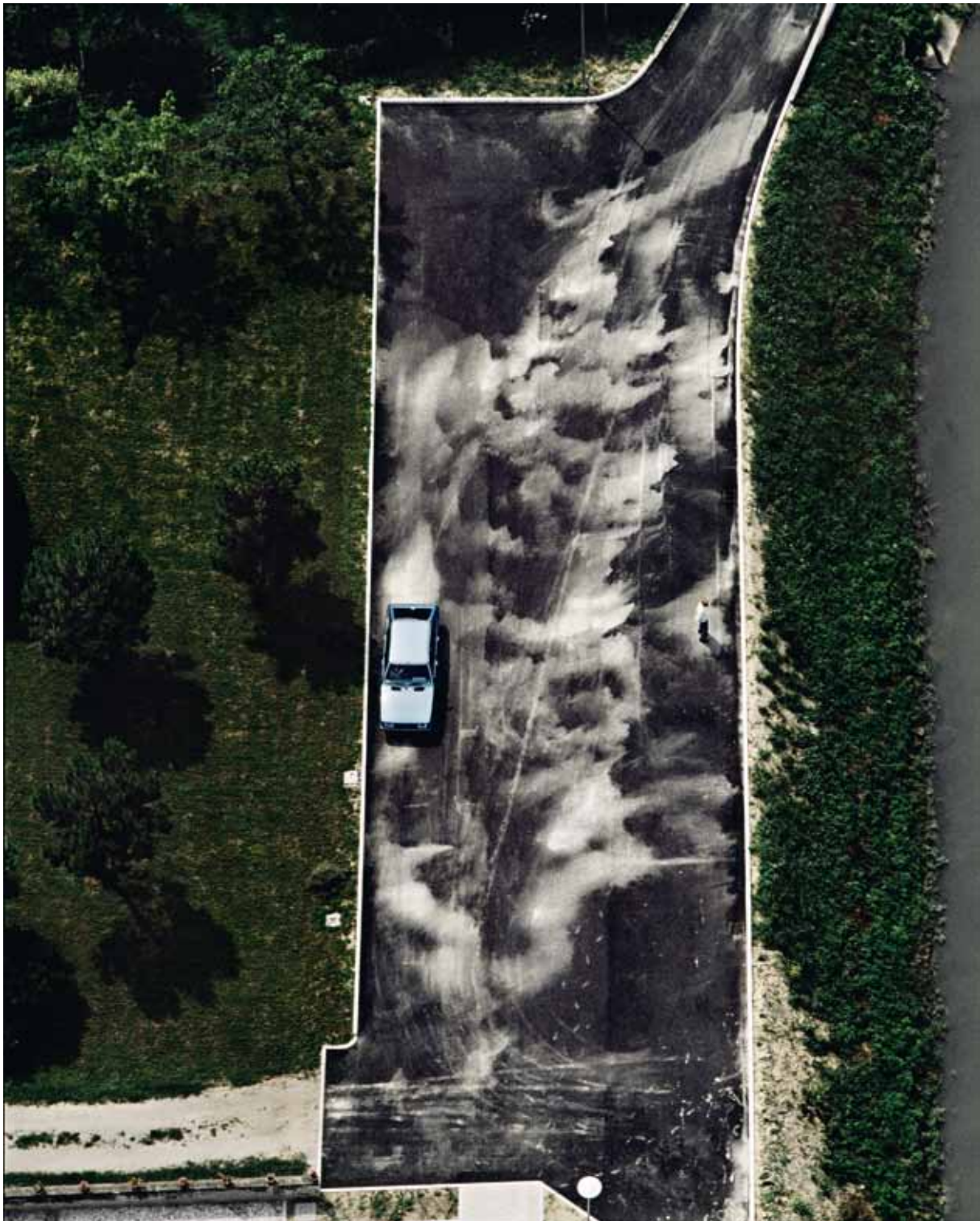
Cielo in un parcheggio dalla serie "Isle of View" 1987-1992.

Stampa (Print) Fine Art Giclée su carta cotone (on rag cotton) Hahnemühle, montata su dibond.