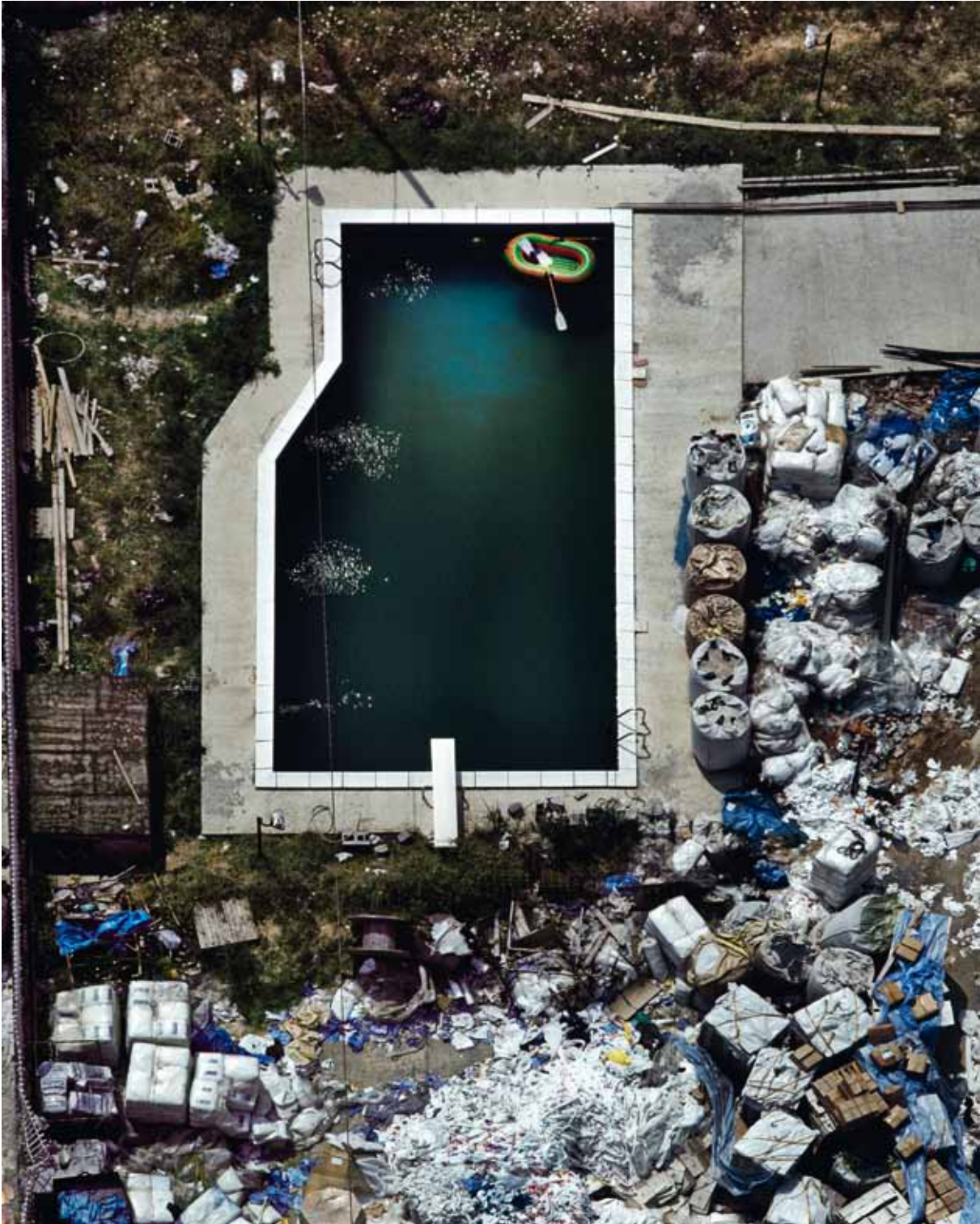
Piscina del XXI° secolo dalla serie "Isle of View" 1987-1992.

Stampa (Print) Fine Art Giclée su carta cotone (on rag cotton) Hahnemühle, montata su dibond.